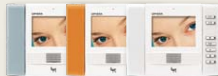
Monitor in weiß mit Abdeckung in artic-grau, orange und weiß