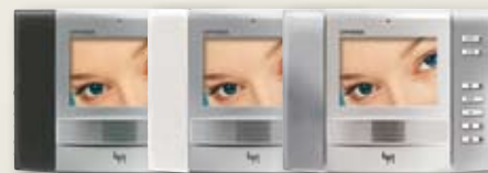
Monitor in silber mit Abdeckung in schwarz, weiß und grau